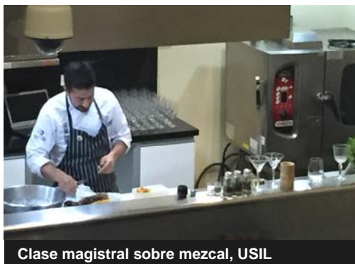
Clase magistral sobre mezcal, USIL