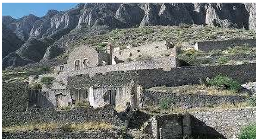
Pueblo fantasma de Ojuela, en Mineral de Santiago de Mapimi, Durango