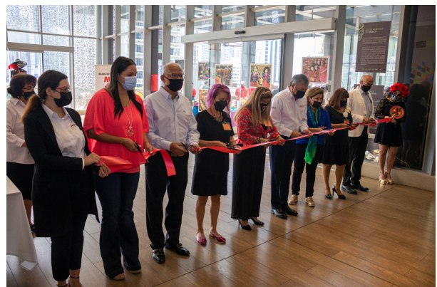
El festival de Día de Muertos fue inaugurado por el Embajador e invitados especiales

El público pudo admirar la exposición fotográfica "Día de muertos en México", en la que jóvenes fotógrafos y fotógrafas mexicanas plasman cómo se celebra el 1 y 2 de noviembre en nuestro país.