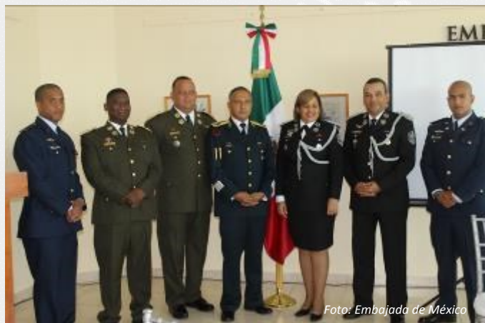
El Agregado Militar de México recibe a invitados

El Ejército mexicano moderno nace durante la Revolución Mexicana el 19 de febrero de 1913, cuando Venustiano Carranza convocó a diversos movimientos populares para restaurar el régimen institucional.