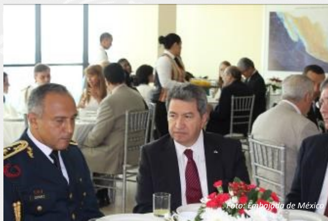
Asistentes al desayuno para conmemorar el Día del Ejército