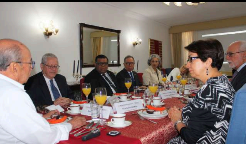
Durante el desayuno, el Embajador Romeo Ruiz Armento agradeció la presencia de los diplomáticos y aprovechó la ocasión para despedirse después de más seis años en Guatemala.