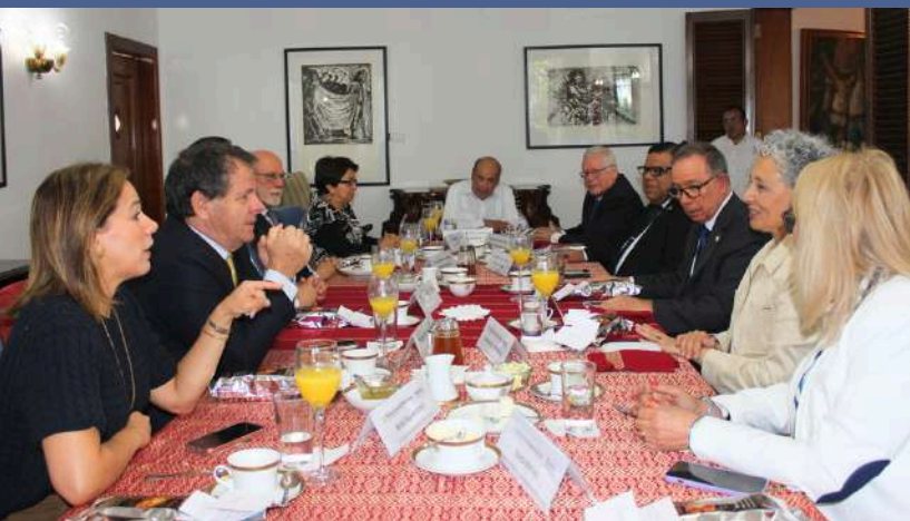
Los Jefes de Misión del Grupo Latinoamericano y del Caribe durante su encuentro dialogaron sobre diversos temas con el fin de estrechar los lazos entre sus naciones.