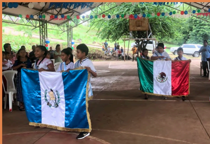
Jóvenes de las comunidades Nuevo México y San Vicente previo al inicio del Consulado Móvil en ese departamento.

Los principales casos presentados fueron de personas que nacieron en México de padres guatemaltecos, quienes regresaron a este país, por lo que cuentan con una doble nacionalidad. 🌎