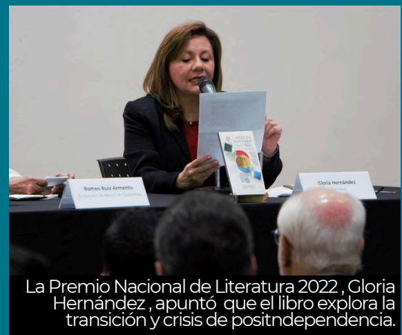
La Premio Nacional de Literatura 2022, Gloria Hernández, apuntó que el libro explora la transición y crisis de posindependencia.