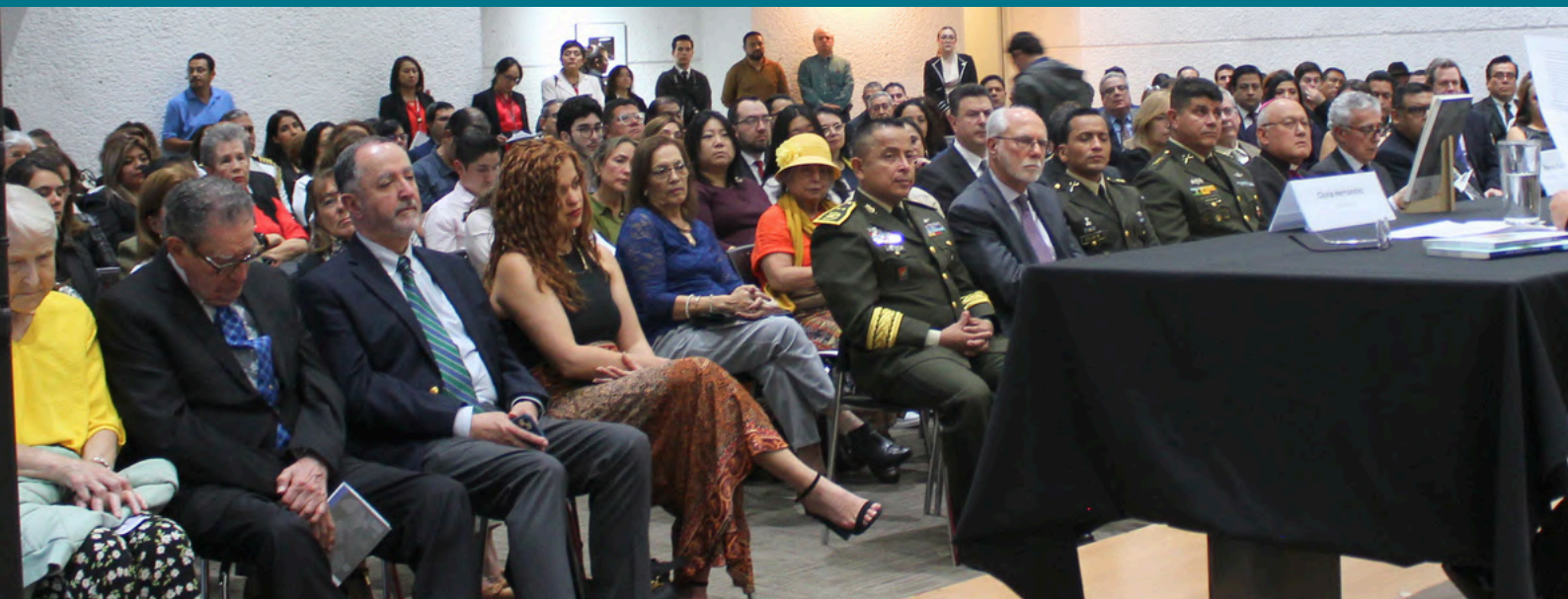
Funcionarios gubernamentales, cuerpo diplomático, representantes del sector privado y público en general atentos de las participación por el libro México y Guatemala, Cultura y Educación, 175 años de relaciones diplomáticas .