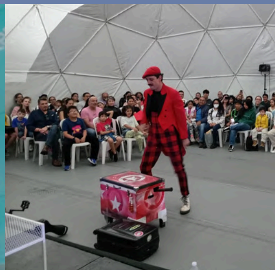
Estudiantes y público que llegó a la Carpa Cultural durante la FILGUA 2024, que ratificó su compromiso cultural, al realizar más de 70 actividades con la presencia de más de 3,800 personas.