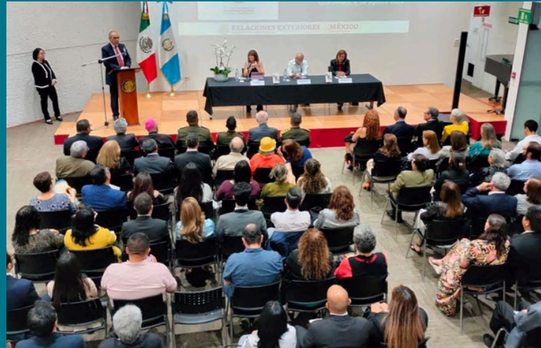
Asistentes a la presentación del libro 175 años de relaciones diplomáticas México Guatemala, Cultura y Educación .

Con la publicación del nuevo libro, esta legación concluyó su colección de materiales con motivo de la efeméride que hace referencia al inicio de relaciones diplomáticas entre ambas naciones. 🌎