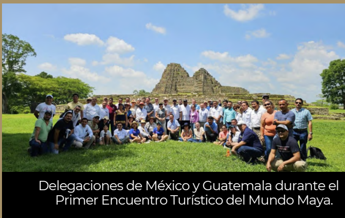
Delegaciones de México y Guatemala durante el Primer Encuentro Turístico del Mundo Maya.

Autoridades y turoperadores de los estados mexicanos de Tabasco y Chiapas, así como del departamento guatemalteco de Petén, en coordinación con el Consulado de México en Petén, realizaron el Primer Encuentro Turístico del Mundo Maya, en el que además de fortalecer vínculos en el sector, conocieron las instalaciones del Tren Maya en esa zona. 🌎