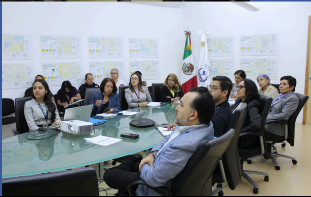
Personal de la Embajada de México en la exposición sobre el Mecanismo Nacional de Prevención de la Tortura en Guatemala .

Recordó que por su naturaleza, este mecanismo es preventivo en materia de tortura y otros tratos o penas crueles, inhumanos o degradantes. 🌍