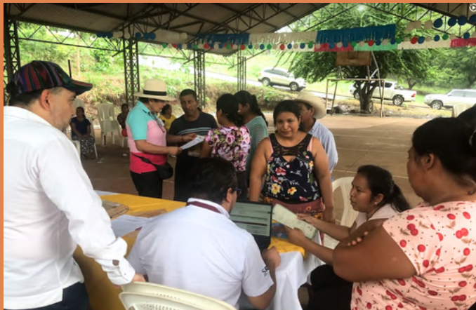
Equipo de la sección consular atendiendo a los connacionales de la comunidad de Nuevo México y San Vicente del departamento de Escuintla.

La Embajada de México, a través de su sección consular, entregó 132 documentos para igual número de personas que tienen la nacionalidad mexicana, pero que actualmente viven en las localidades de Nuevo México y San Vicente, departamento de Escuintla.