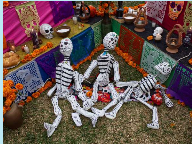
Calacas que fueron parte de los detalles de la ofrenda por el Día de Muertos que realizó la Embajada de México el 2 de noviembre de 2023.