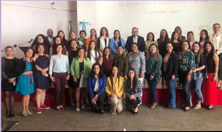
Participantes del Programa Consular de Emprendimiento para Mujeres mexicanas en el exterior , en la ceremonia de inauguración en el auditorio Luis Cardoza y Aragón.

Participaron como aliados estratégicos BAC - Credomatic, los ministerios de Previsión Social, Economía y Trabajo, la Superintendencia de Administración Tributaria, además de Wonder Woman y Pro Mujer, que ofrecieron talleres sobre diversos temas como relaciones laborales, finanzas, innovación, leyes y regulaciones tributarias, entre otros. 🌟