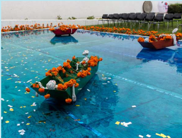
Detalle de la magna ofrenda por el Día de Muertos que este año emuló los canales de Xochimilco, declarados Patrimonio de la Humanidad desde 1987.