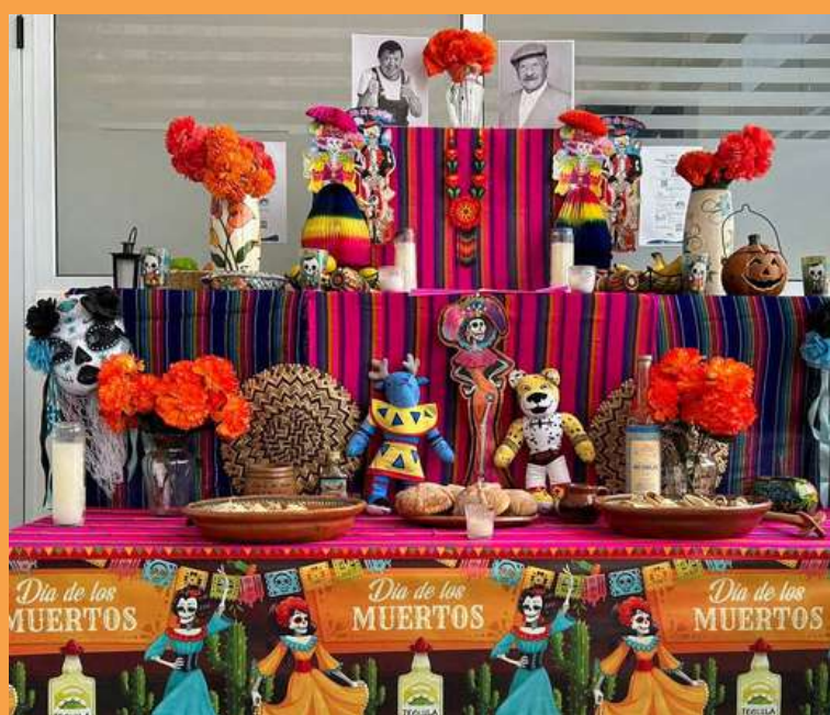
Altar del Consulado en Tecún Umán, San Marcos.