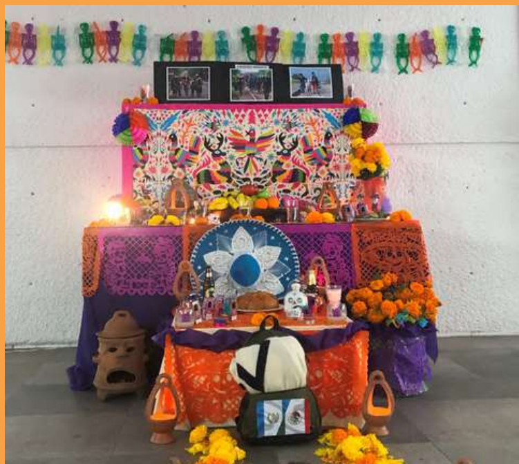
Altar del Consulado en Ciudad de Guatemala.