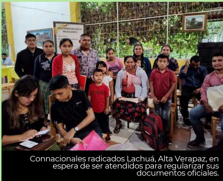
Connacionales radicados Lachuá, Alta Verapaz, en espera de ser atendidos para regularizar sus documentos oficiales.

El evento tuvo la finalidad de acercar los servicios consulares a las personas mexicanas que radican en las aldeas más alejadas de la Embajada.