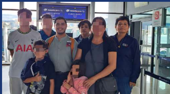
Familia mexicana que se quedó atrapada en los bloqueos de carreteras de octubre pasado y que fueron apoyados por Protección Consular para su retorno.

Al mismo tiempo que facilitó la documentación para el retorno los connacionales, quienes fueron traídos a este país de manera equivocada por migración de Estados Unidos. 🙏