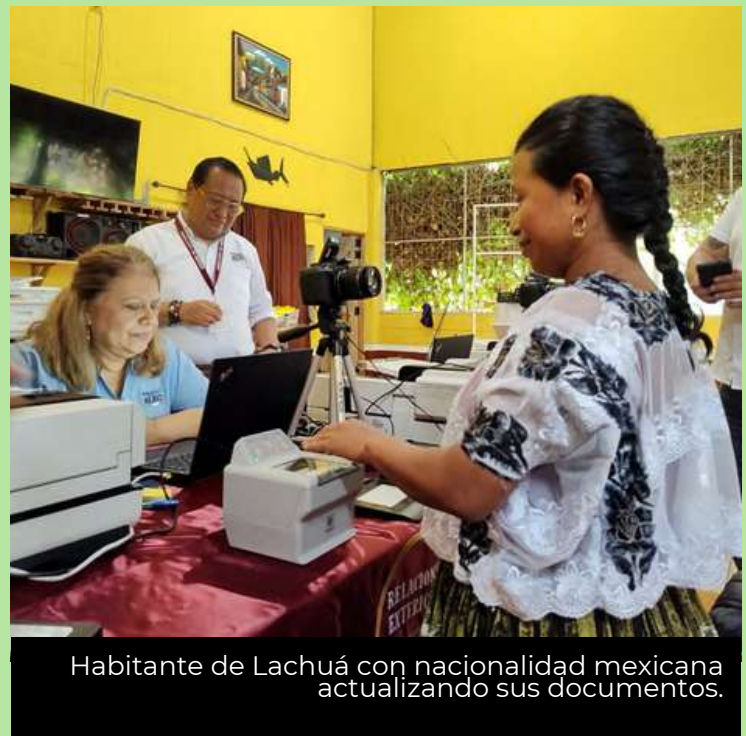
Habitante de Lachuá con nacionalidad mexicana actualizando sus documentos.

Finalmente, se destaca y agradece el apoyo del personal directivo de la escuela oficial rural mixta de la localidad, que amablemente expidió constancias de estudio a los connacionales que las necesitaron para tramitar algún documento. 🇲🇽