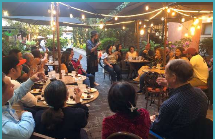
Asistentes a la cata de mezcal en el restaurante Quintana Bistrot

Las degustaciones fueron en los restaurantes La Poza , Quintana Bistrot y Órale el Capi , donde se presentó la firma Marín&Marín, que explicó el origen y cualidades de esta bebida, al tiempo que se promovió la marca a diversas comercializadoras en Guatemala. 🌟