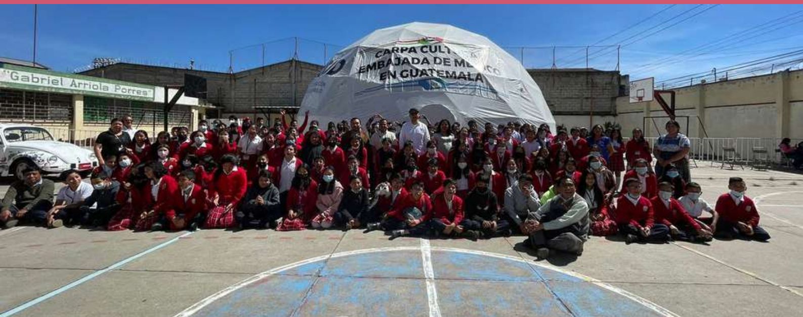
Estudiantes de la escuela Benito Juárez, integrantes del programa Escuelas México en la Carpa Cultural de la Embajada de México instalada en el Instituto Nacional Experimental Gabriel Arriola Porres, en Quetzaltenango.