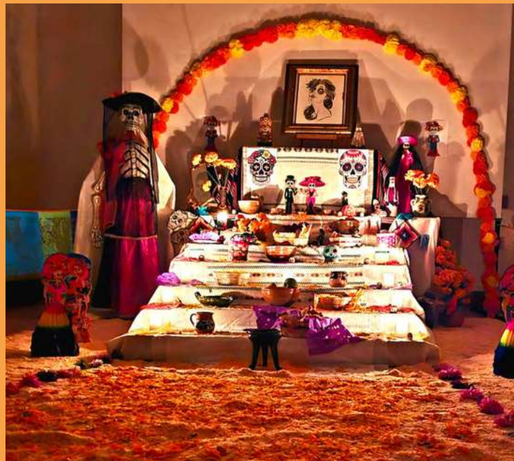
Altar del Consulado en Chimaltenango, Chimaltenango.

Los consulados de México en Guatemala se sumaron a estas acciones para mantener la tradición del Día de Muertos, con emotivos altares, que este año fueron dedicados a las víctimas que dejó el huracán Otis, en el estado mexicano de Guerrero.