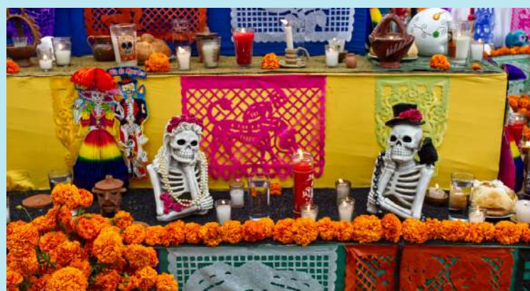
Detalle de la ofrenda instalada en los jardines de la Embajada de México, que este año además recreó los canales de Xochimilco, en el sur de la capital del país.