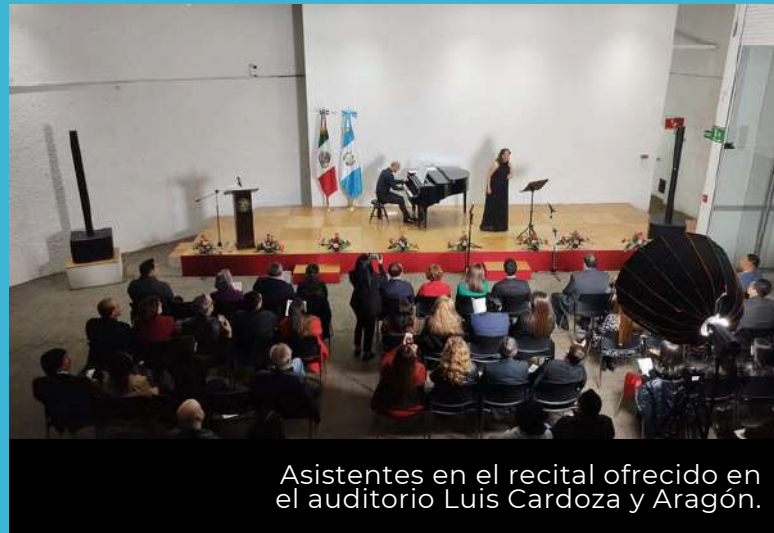
Asistentes en el recital ofrecido en el auditorio Luis Cardoza y Aragón.