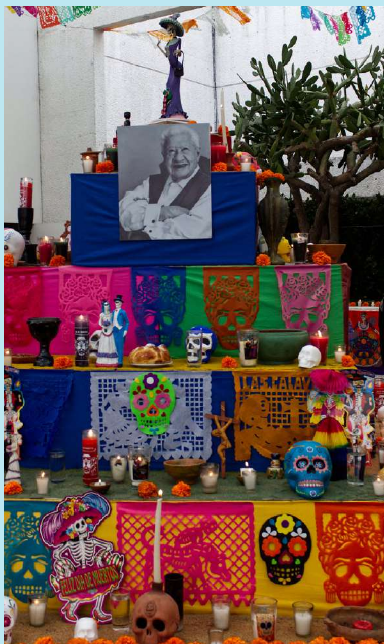
Ofrenda por el Día de Muertos en recuerdo del historiador mexicano Ignacio López Tarso (1925-2023), considerado una de las figuras más reconocidas en el cine y teatro de su país.

Los jardines de la representación además se complementaron con la presencia de decenas de personas disfrazadas de catrinas y catrines, quienes dieron un colorido a este evento que se ha convertido en referente en Guatemala.