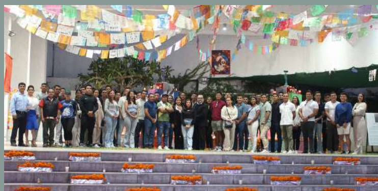
Cadetes y oficiales del Buque Escuela Cuauhtémoc durante un recorrido por la Embajada de México en Guatemala.

El Crucero de Instrucción “Ibero – Bizantino 2023” navegó del 23 de abril al 23 de diciembre pasados, e incluyó 20 puertos de 13 países de América, Europa y Asia.