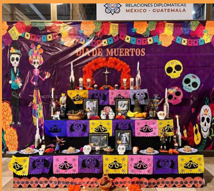
Altar del Consulado en Flores, Petén.

Además, recordaron a los migrantes, que han perdido la vida en busca de nuevas oportunidades y a dos importantes figuras de la cultura mexicana que fallecieron en 2023, los actores Javier López "Chavelo" e Ignacio López Tarso. 🌻