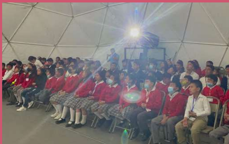
Estudiantes que forman parte del programa Escuelas México durante una proyección en el Instituto Nacional Experimental Gabriel Arriola Porres, en Quetzaltenango.