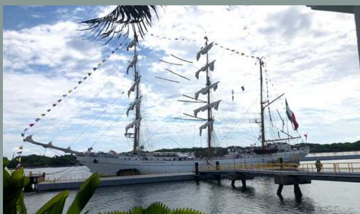
El buque escuela Cuauhtémoc de la Armada de México en Puerto Quetzal, Pacífico de Guatemala.