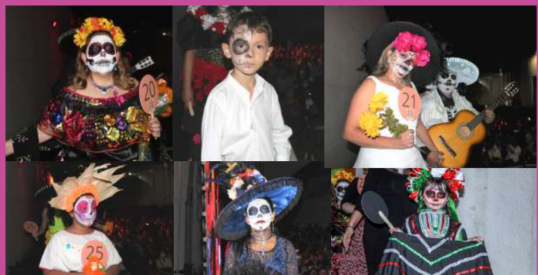
Algunos de los 27 Participantes del concurso La Catrina más Catrina 2022 .