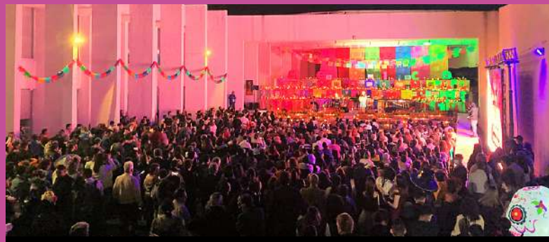
Con una gran participación celebró la Embajada de México en Guatemala el tradicional Día de Muertos.