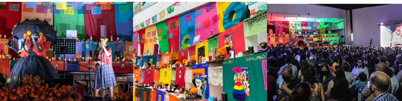
Asistentes al concierto Ofrenda Musical. Recordar es vivir en la Embajada de México, en el marco de la celebración festividades del Día de Muertos

Cabe recordar que esta festividad mexicana forma parte del Patrimonio Oral e Intangible de la Humanidad desde 2003 y del Patrimonio Cultural Inmaterial de la Humanidad desde 2008. 🌻