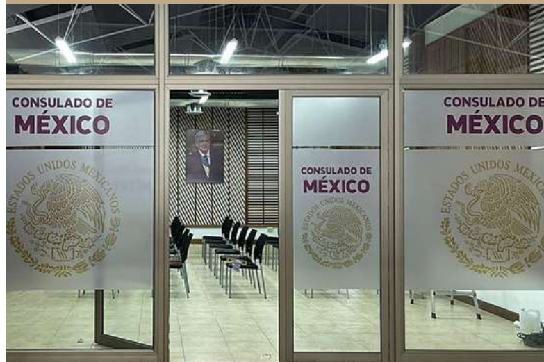
Entrada Principal del Consulado de México en el departamento de Petén.

El Consulado estará el Centro Comercial Metro Plaza Mundo Maya, frente al aeropuerto en Flores, Departamento de Petén. 🇲🇽