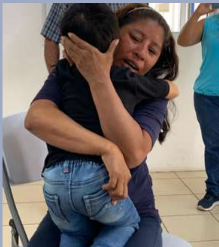
Menor de cuatro años que se logró generar pasaporte mexicano se reencuentra con su madre.

Otro caso destacable fue el de una mujer de 22 años, quien no había podido obtener la nacionalidad mexicana, a pesar de ser hija de