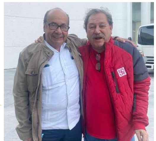
El Embajador de México en Guatemala, Romeo Ruiz Armento, y el director general de la Editorial Fondo de Cultura Económica (FCE), Pago Ignacio Taibo II.

El Embajador de México en Guatemala, Romeo Ruiz Armento, recibió el pasado 2 de diciembre al Director General de la Editorial Fondo de Cultura Económica (FCE), Paco Ignacio Taibo II, con quien dialogó sobre futuros planes de cooperación cultural para traer a este país centroamericano. 🌍