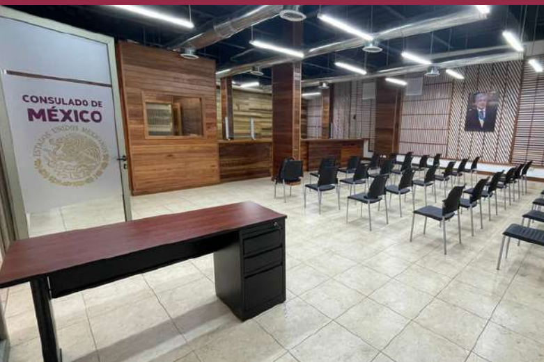
Sala de atención al público del Consulado de México en el departamento de Petén.