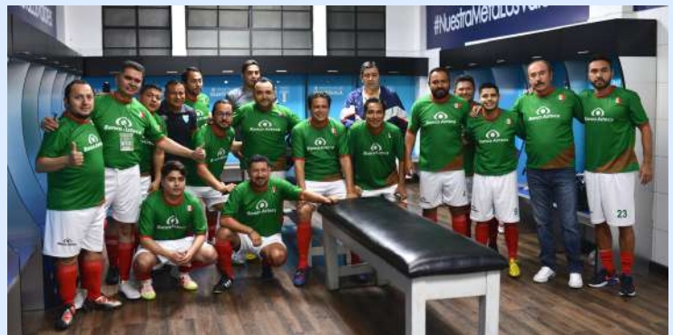
El selectivo de mexicanos residentes en Guatemala previo al encuentro amistoso.

Los himnos nacionales de ambas escuadras se entonaron antes del arranque del encuentro, que reunió a unas 500 personas, quienes disfrutaron, en un ambiente familiar, del partido promovido por el Instituto de los Mexicanos en el Exterior (IME) de la Secretaría de Relaciones Exteriores.