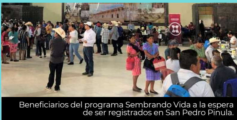
Beneficiarios del programa Sembrando Vida a la espera de ser registrados en San Pedro Pinula.

El Proyecto prevé que el apoyo en especie se adaptará a las necesidades de cada región, tomando en cuenta sus condiciones climáticas, tipo de suelo, así como respetando las especies endémicas y las costumbres de siembra. 🌱