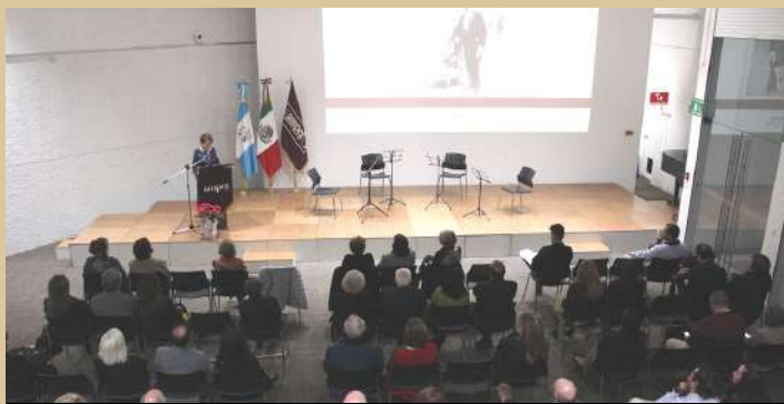
Reunión anual de la Asociación de Mujeres Periodistas y Escritoras de Guatemala (AMPEG).

El Instituto Cultural de México fue sede de la celebración del Día del Periodista de la Asociación de Mujeres Periodistas y Escritoras de Guatemala (AMPEG). En el acto ingresaron a nuevas integrantes; se recordó al escritor Enrique Gómez Carrillo, y se presentó el libro Cálices y rituales de la poeta Carmen Matute. El festejo culminó con un concierto del Cuarteto Strauss, que ejecutó diversas piezas mexicanas. 🌟