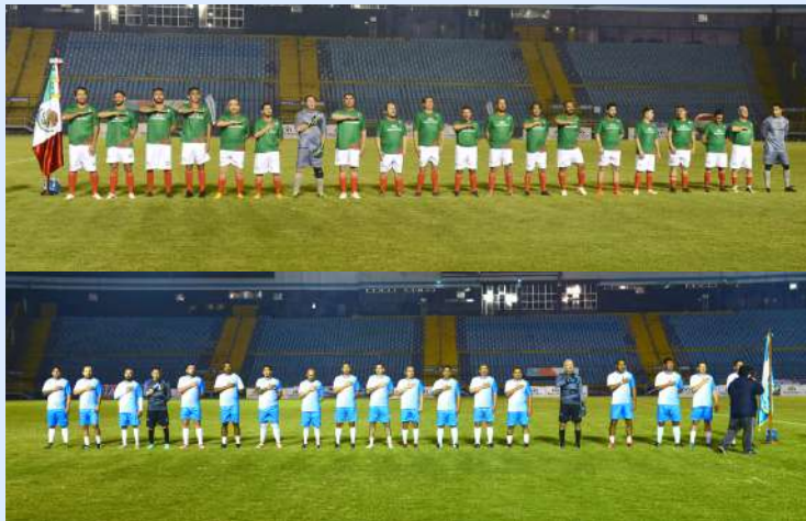
Los equipos de México y Guatemala escuchando sus himnos nacionales.

La justa, que terminó con un marcador de 5-1 a favor de los albicelestes, fue organizada por la Embajada de México, a través de la Sección Consular y la Federación Guatemalteca de Fútbol, en el marco de los festejos por el 112 aniversario de la Revolución Mexicana.