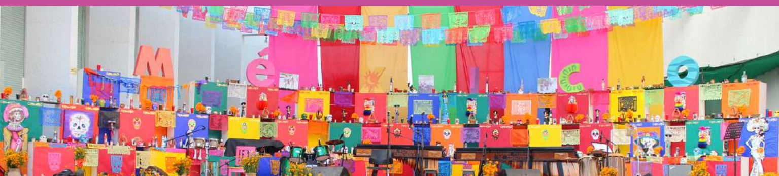
Altar de Muertos dedicado a los migrantes, que en su búsqueda de nuevas oportunidades pierden la vida.