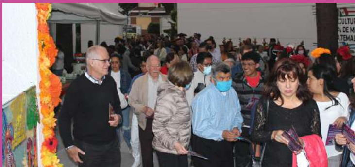
Desde las 17:00 horas, mexicanos y guatemaltecos ingresaron a la sede diplomática en un ambiente festivo.