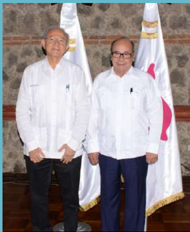
De izquierda a derecha: El subsecretario de turismo de México, Humberto Hernández Haddad, junto con el Embajador de México, Romeo Ruiz Armento.

Con este nuevo instrumento se facilitará la búsqueda de lugares que integran esta región a través del sitio web www.gomundomaya.com y en el que los usuarios podrán localizar sitios arqueológicos y reservas naturales emblemáticas en cada uno de los países que la integran.