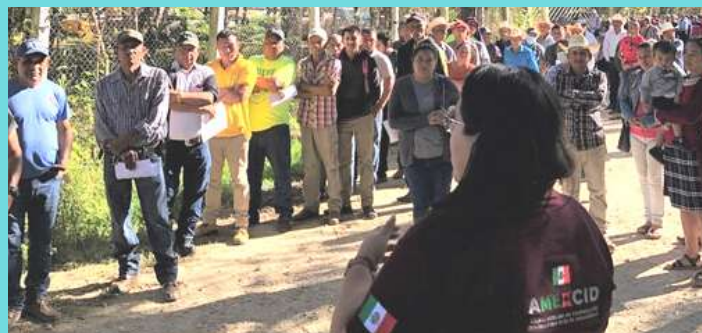
Técnica de la Agencia Mexicana de Cooperación Internacional para el Desarrollo (AMEXCID) explicando a beneficiarios como registrarse.

Los beneficiarios de este importante Proyecto que también se implementa en México, El Salvador, Honduras, Belice y Cuba, podrán desarrollar bio-fábricas, amigables con el medio ambiente, para la obtención de abonos y productos orgánicos contra plagas.