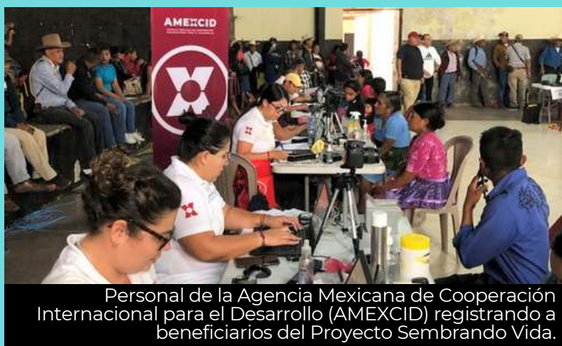
Personal de la Agencia Mexicana de Cooperación Internacional para el Desarrollo (AMEXCID) registrando a beneficiarios del Proyecto Sembrando Vida.

En esta etapa se contó con el apoyo del Ministerio de Agricultura, Ganadería y Alimentación, de la Dirección de Coordinación Regional y Extensionismo Rural de El Salvador, que son parte del proyecto Sembrando Vida en ese país.