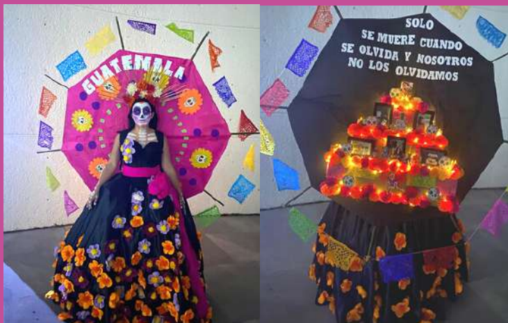
La guatemalteca Madeline Aguilar fue la ganadora del Concurso La Catrina más Catrina 2022 , al plasmar en su disfraz elementos biculturales e incluir el tema de los migrantes que también estuvo en Altar Central.