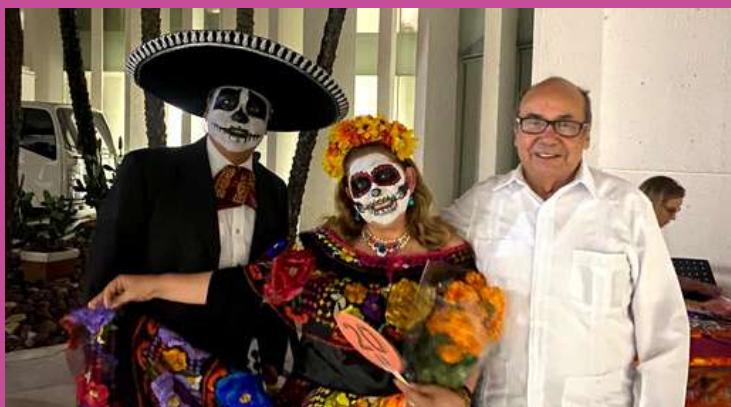
El Embajador Romeo Ruiz Armento compartió con los participantes del concurso de La Catrina más Catrina 2022 .