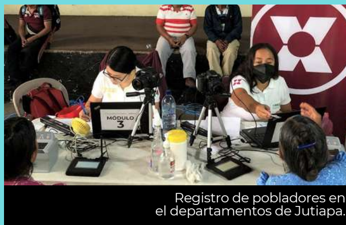
Registro de pobladores en el departamento de Jutiapa.