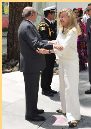
Embajadora de Brasil en Guatemala, Vera Cíntia Álvarez.