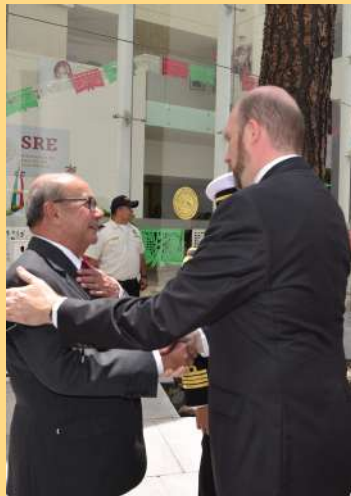
Embajador de Estados Unidos en Guatemala, William Popp.