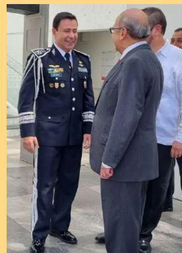
Ministero de la Defensa Nacional, General de División Henry Reyes Chigua.