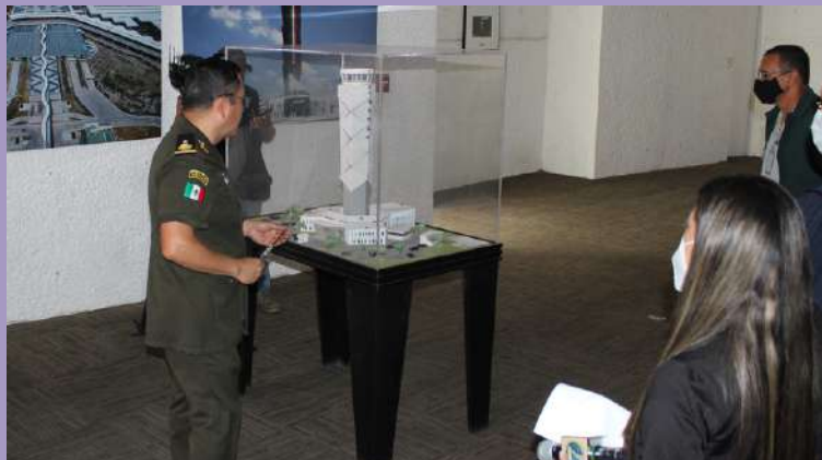
El Agregado Militar y Aéreo, General Gregorio Espinosa Toledo, describe las características de la Torre de Control del Aeropuerto Internacional Felipe Ángeles (AIFA).

El AIFA es un aeropuerto verde, ya que el 50 por ciento de la energía que consume es generada por una central de gas natural y tres campos fotovoltaicos. 🌱