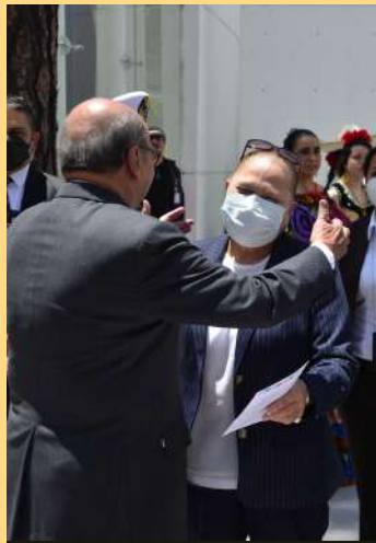
Fiscal General de Guatemala, Consuelo Porras Argueta.