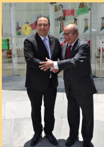
Ministero de Relaciones Exteriores de Guatemala, Mario Búcaro.