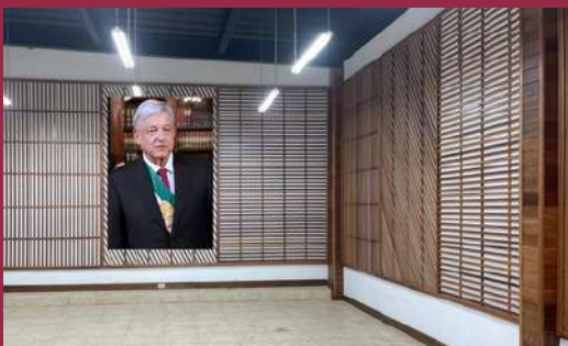
Zona de recepción del Consulado de México en Flores, Petén

El acondicionamiento del nuevo Consulado de México en Flores, departamento de Petén, avanza y se espera la conclusión de los trabajos en breve, para proceder a su equipamiento y designación de personal.