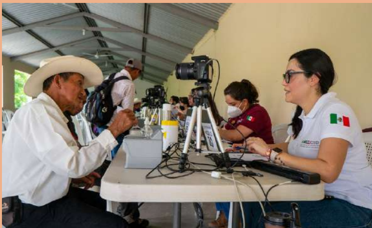
Delegación de la Agencia Mexicana de Cooperación Internacional para el Desarrollo (AMEXCID) ingresando datos de los beneficiarios del Proyecto Sembrando Vida.

El proyecto Sembrando Vida en Guatemala actualmente cuenta con un padrón de 2 mil 375 personas de los departamentos de Chimaltenango, El Progreso y Zacapa, quienes podrán recibir recursos, insumos y asesoría técnica. 🌱