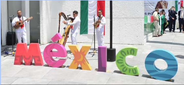
Grupo Jarocho "Los Tigres de la Costa" amenizaron la fiesta nacional de México.