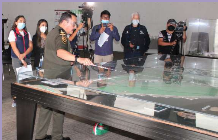
El Agregado Militar y Aéreo, General Gregorio Espinosa Toledo, explica detalles del Aeropuerto Internacional Felipe Ángeles (AIFA).

La terminal aérea fue realizada en el marco de la política del Gobierno de México, sin perder de vista la innovación, eficiencia y funcionalidad, colocándola como una de las más importantes y modernas en el país.