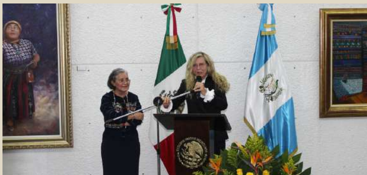
La artista y diplomática, Vera Cíntia, en la inauguración de la exposición "Guatemala Sublime".

La artista y diplomática brasileña Vera Cíntia presentó su exposición "Guatemala Sublime" en la Galería José Gorostiza del Instituto Cultural de México, que la integran 15 obras al óleo, las cuales buscan transmitir las tradiciones ancestrales e indígenas de este país.