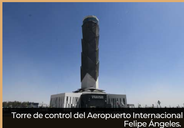
Torre de control del Aeropuerto Internacional Felipe Ángeles.