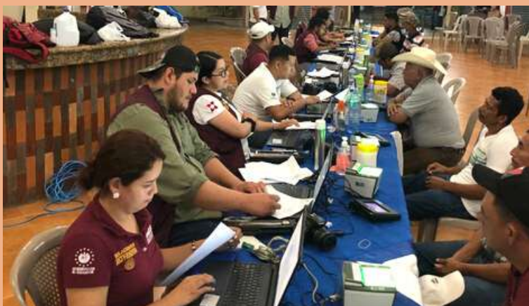
Delegación de la Agencia Mexicana de Cooperación Internacional para el Desarrollo (AMEXCID) tomando datos de los beneficiarios.