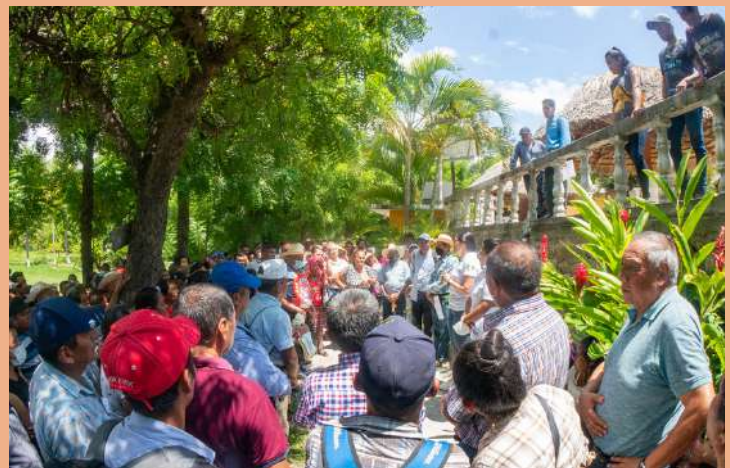
Habitantes del departamento de El Progreso en al registro para el Proyecto Sembrando Vida.