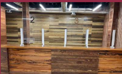
Ventanillas de atención del Consulado de México en Flores, Petén

El acondicionamiento del nuevo Consulado de México en Flores, departamento de Petén, avanza y se espera la conclusión de los trabajos en breve, para proceder a su equipamiento y designación de personal.