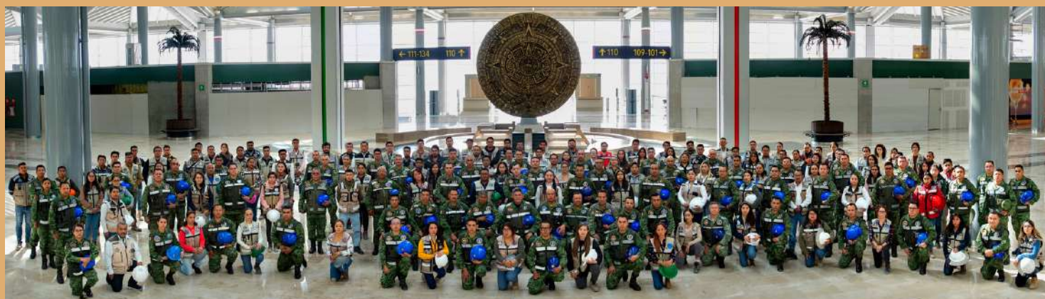
Personal que laboró en la construcción del Aeropuerto Internacional Felipe Ángeles.