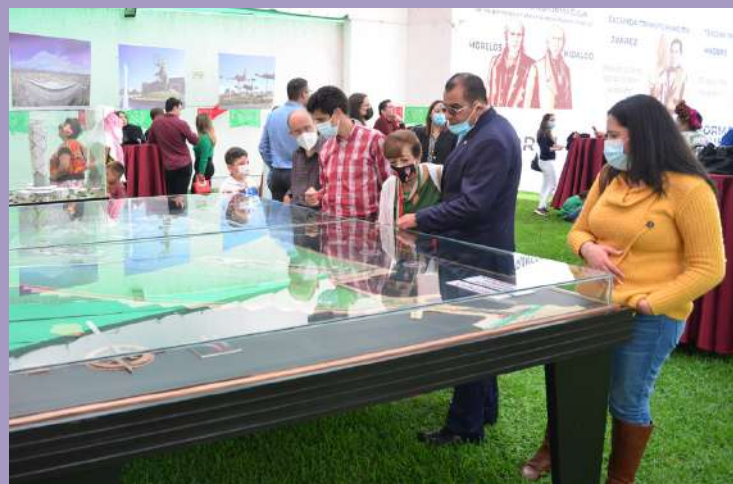
Visitantes conocen las maquetas y fotografías del Aeropuerto Internacional Felipe Ángeles (AIFA).

La exposición forma parte de las festividades que realizó esta Representación diplomática con motivo del 212 Aniversario del inicio de la gesta por la Independencia de México.