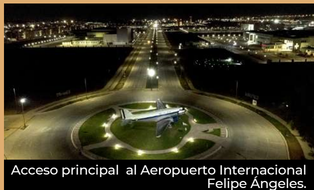
Acceso principal al Aeropuerto Internacional Felipe Ángeles.