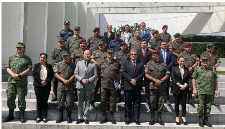
Integrantes del Curso de Altos Estudios Estratégicos que imparte el Comando Superior de Educación del Ejército de Guatemala visitaron la Embajada de México en el marco de su programa académico.

Integrantes del Curso de Altos Estudios Estratégicos que imparte el Comando Superior de Educación del Ejército de Guatemala visitaron el pasado 12 de octubre la Embajada de México en este país, con el fin de conocer sus instalaciones y escuchar una plática sobre la seguridad en México, impartida por el Agregado Militar y Aéreo, General Gregorio Espinosa Toledo.