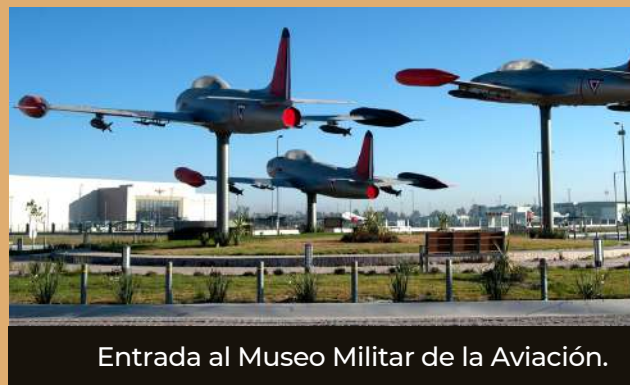
Entrada al Museo Militar de la Aviación.