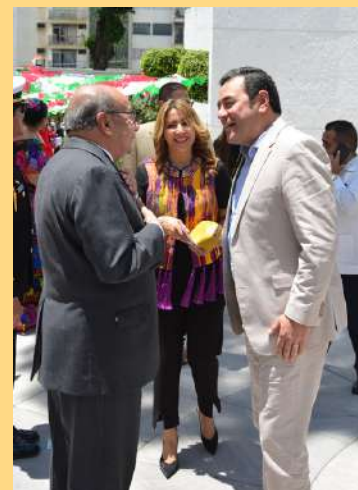
Expresidente de Guatemala, Jimmy Morales.