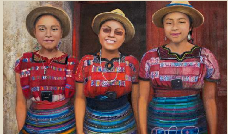
Obra: Tres celulares y sus dueñas, autora Vera Cíntia

Cíntia, quien actualmente es Embajadora de Brasil en este país y diplomática desde 1982, calificó a su exposición como un homenaje a hombres y mujeres que diariamente luchan para transformar Guatemala. 🌱