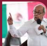
Romeo Ruíz Armento, Embajador de México en Guatemala.

La idea de su creación surgió en el marco de la pandemia de Covid-19, luego de la reducción de recursos para actividades culturales,