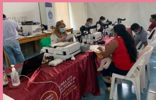
Mexicanos realizando trámites en el Consulado Móvil en Cobán.