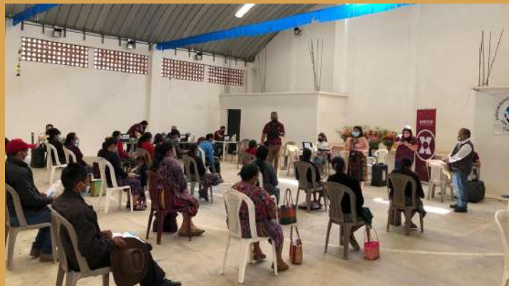
Registro de los primeros beneficiarios del Proyecto Sembrando Vida que implementa la Agencia Mexicana de Cooperación Internacional para el Desarrollo (AMEXCID) en Chimaltenango.

La Agencia Mexicana de Cooperación Internacional para el Desarrollo (AMEXCID) comenzó a registrar a los primeros beneficiarios del Proyecto Sembrando Vida en Guatemala, con lo que se espera que próximamente inicie su aplicación en el departamento de Chimaltenango.