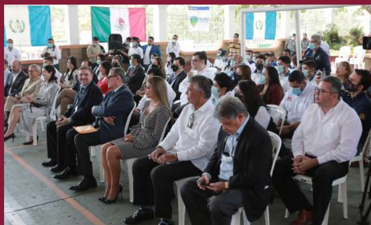
Invitados a la inauguración de la Carpa Cultural de la Embajada de México en Guatemala.