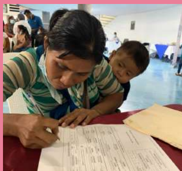
Ciudadana mexicana firmando documentos.