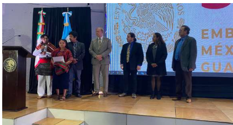
Miembros de la comunidad maya en la entrega de obsequios a los ponentes.

Puedes escucharlo en : https://youtu.be/gcDEITyvFIK