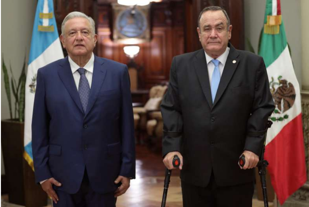
Presidente de México, Andrés Manuel López Obrador, y su homólogo de Guatemala, Alejandro Giammattei Falla.

El Presidente de México, Andrés Manuel López Obrador, concluyó una visita de trabajo a Guatemala, en la que ratificó a su homólogo Alejandro Giammattei Falla, su compromiso para promover la integración económica y prosperidad regional, así como la cooperación para reducir las causas que generan la migración.