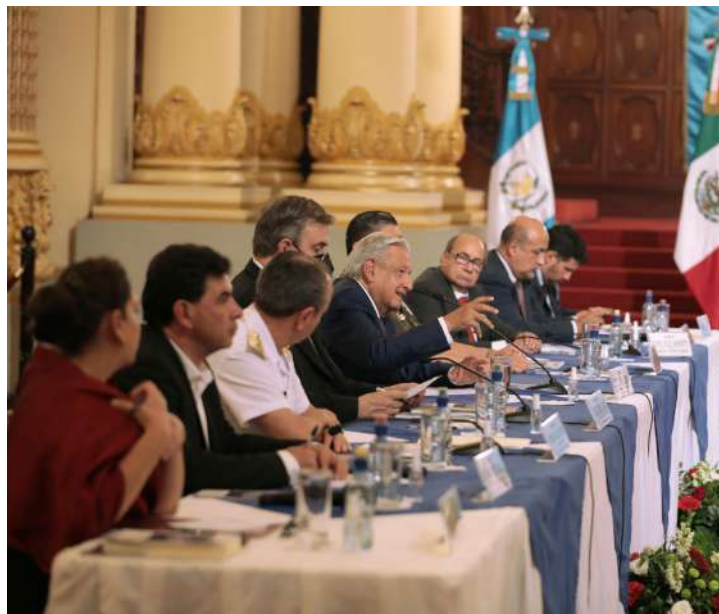
Al centro el Presidente de México, Andrés Manuel López Obrador, encabeza la reunión bilateral con autoridades de Guatemala en el marco de su visita a esta nación.

Un tema de particular atención fue el anuncio para la instalación del Consulado de México en el departamento de Petén, con lo que Guatemala será el país de América Latina y el Caribe con la mayor red consular de México.