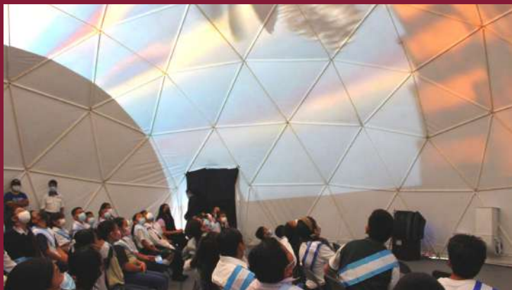
Niños disfrutando de una función en la Carpa Cultural de México en Guatemala.

Falta mucho por recorrer, pero esto es sólo el inicio de un proyecto que seguro seguirá creciendo en creatividad y aportaciones de nuevos actores convencidos de la necesidad de llevar cultura y diversión a los rincones más lejanos y rurales de Guatemala. 🌎