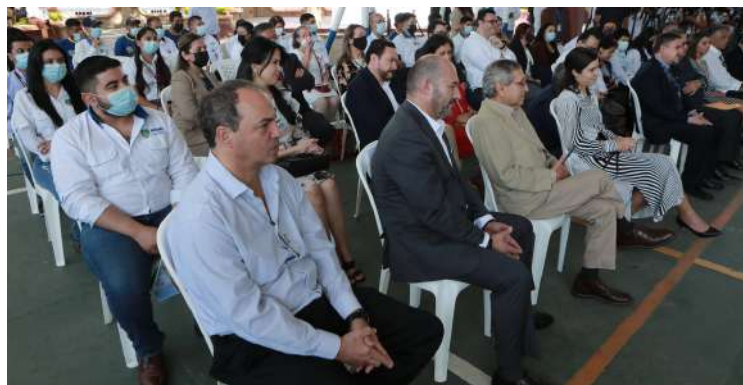
Invitados en la inauguración de la Carpa Cultural de la Embajada de México en Guatemala en el municipio de Palencia.