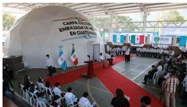
Acto inaugural de la Carpa Cultural de la Embajada de México en el Municipio de Palencia.

Dijo estar complacido por haberse escogido a Palencia como el arranque de actividades de este esfuerzo cultural, que seguro "será una oportunidad para reflexionar acerca del comportamiento de la vida y de nuestras acciones como ciudadanos". 🌍