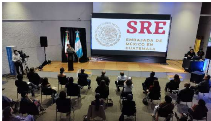
Asistentes en el foro "Grandes civilizaciones Pirámides y culturas sagradas".

El Instituto Cultural de México en Guatemala fue sede el pasado 15 de mayo del foro "Grandes civilizaciones. Pirámides y culturas sagradas", que reunió a arqueólogos y especialistas, quienes expusieron sobre Egipto, México y Guatemala, países que tienen las pirámides más grandes del mundo.