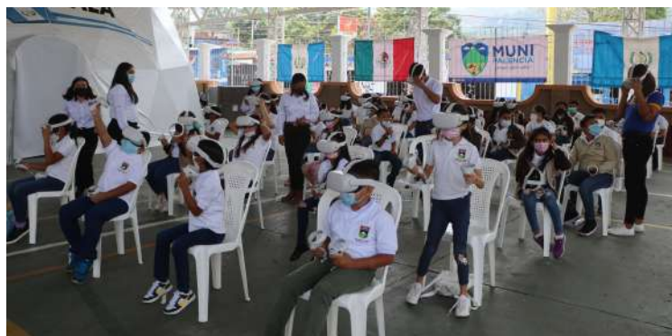
Alumnos de primaria del Municipio de Palencia usando la tecnología 3D a través de Oculus.

"Efectivamente, esta guayabera es el recuerdo de la visita del Presidente Andrés Manuel López Obrador recientemente a Guatemala; así que dígame que calculó bien la medida", comentó el mandatario guatemalteco al Embajador.