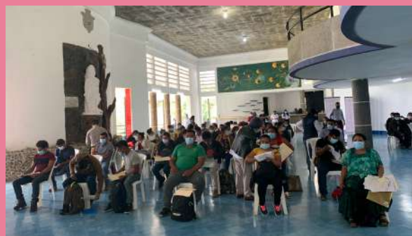
Mexicanos esperando ser atendidos en el Consulado Móvil.

Ante la amplia presencia de mexicanos en diferentes regiones de Guatemala, se espera que para 2023 se celebren cuatro consulados móviles al año. 🌎