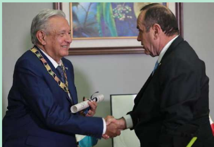
El Presidente de México, Andrés Manuel López Obrador, luego de recibir la Orden del Quetzal en Grado de Gran Collar, de su homólogo de Guatemala, Alejandro Giammattei Falla.