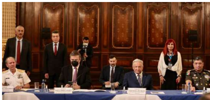
En primera línea el Presidente de México, Andrés Manuel López Obrador e integrantes de su gabinete, junto con los gobernadores en segunda fila (de derecha a izquierda) de Campeche, Layda Sansores San Román; de Chiapas, Rutilio Escandón Cardenas, y de Tabasco, Carlos Manuel Merino Campos, en la reunión bilateral con autoridades de Guatemala.

La visita del presidente López Obrador concluyó la mañana del 6 de mayo, para continuar su periplo por El Salvador, Honduras, Belice y Cuba, donde además de reunirse con sus homólogos, revisó temas de interés bilateral y regional, al mismo tiempo que suscribió diversos acuerdos. 🌿