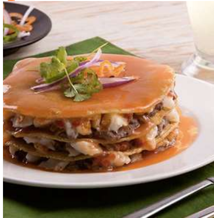
Pain de cazón