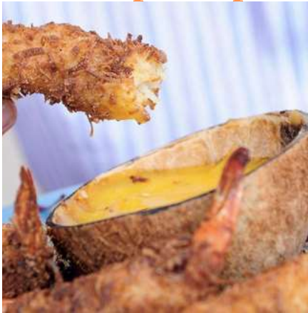
crevette à la noix de coco