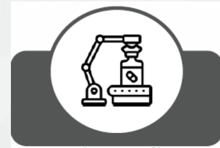
Equipo médico y fármacos