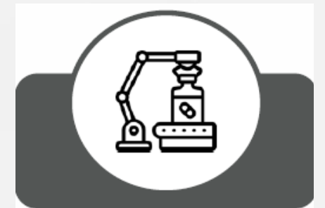
Equipo médico y farmacéutico