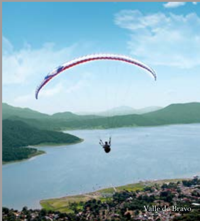
Valle de Bravo