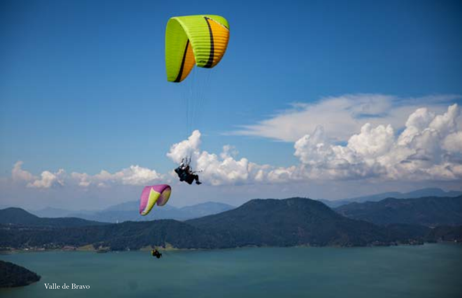
Valle de Bravo