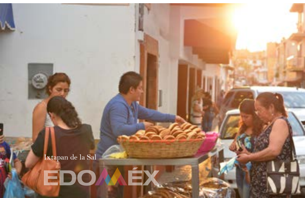
Ixtapan de la Sal