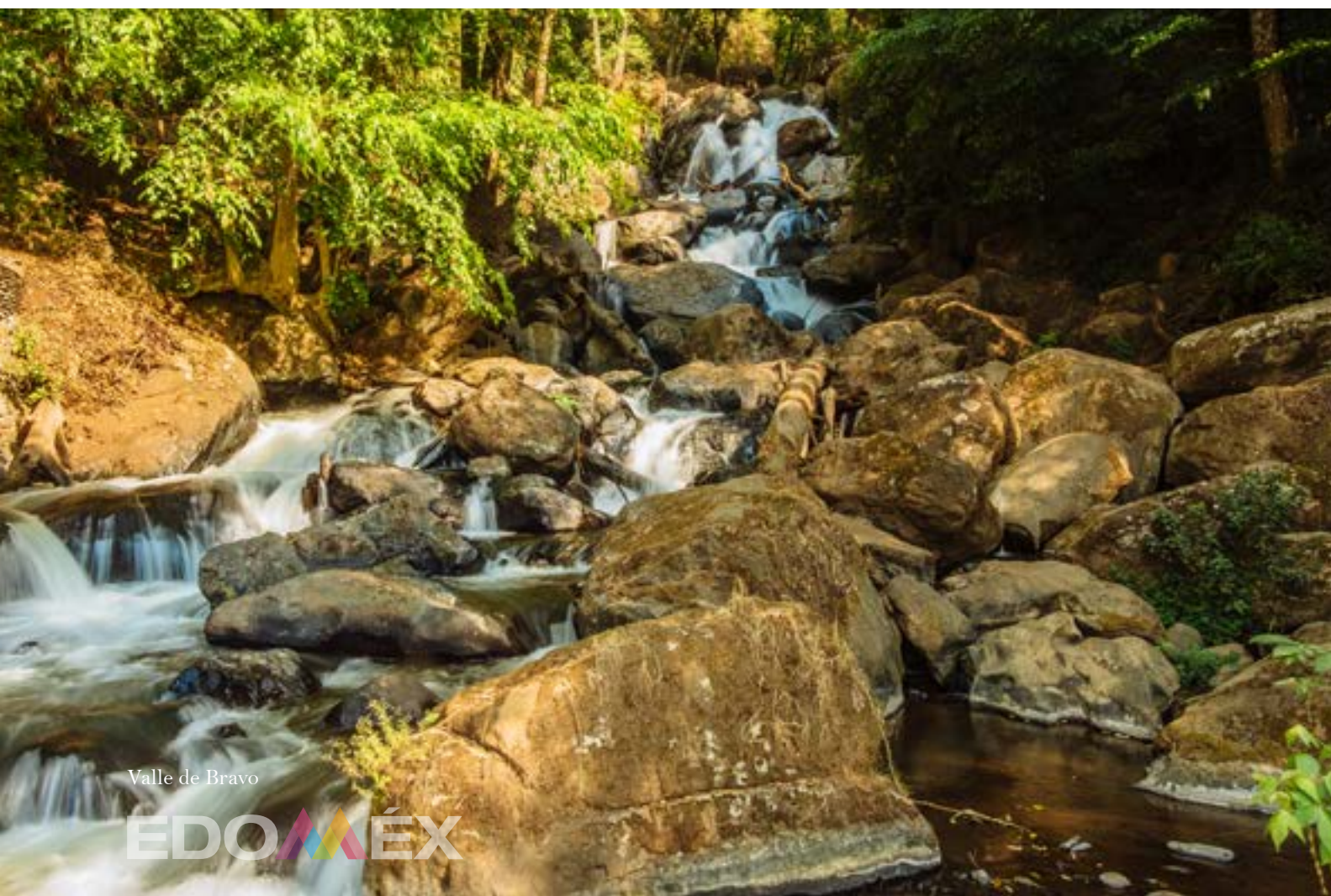
Valle de Bravo