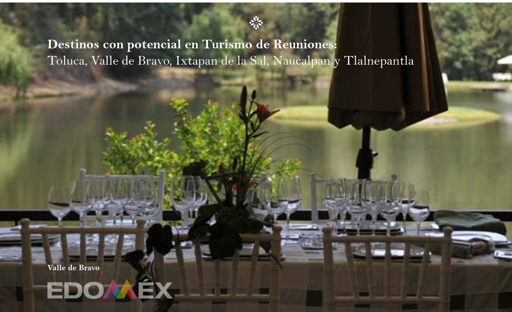
Valle de Bravo

Destinos con potencial en Turismo de Reuniones: Toluca, Valle de Bravo, Ixtapan de la Sal, Naucalpan y Tlalnepantla