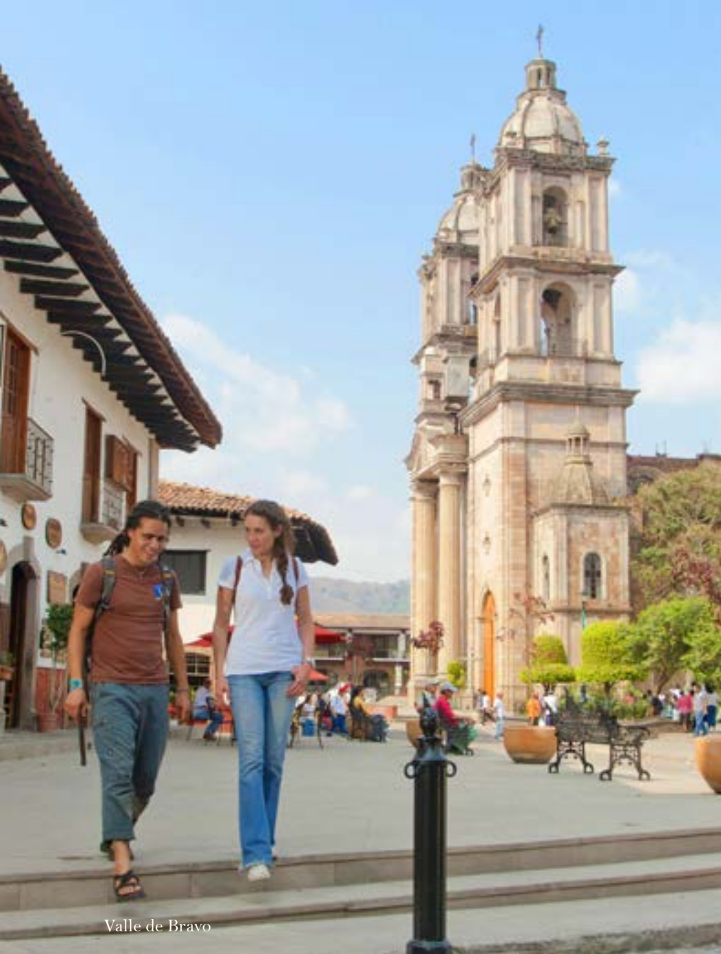
Valle de Bravo