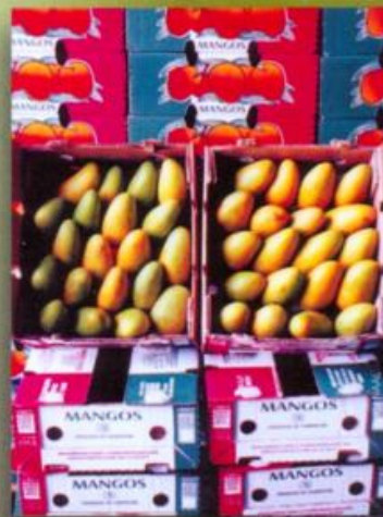
Exportación de Mango