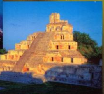
Zona Arqueológica de Edzná