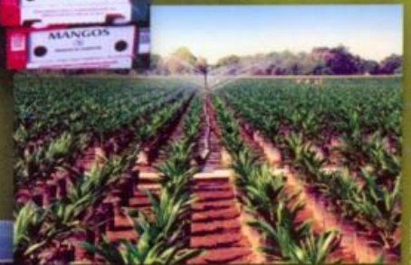
Plantación de Palma