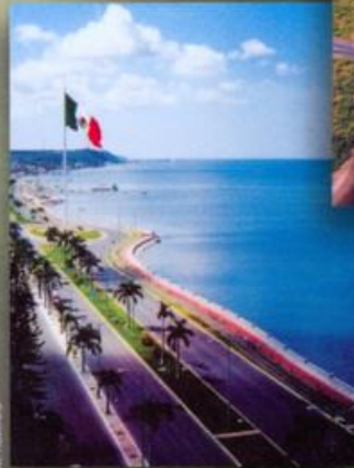
Malecón de Campeche