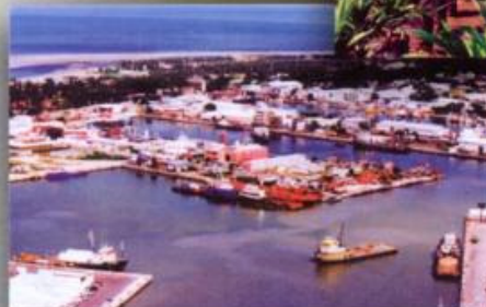
Puerto Marítimo Cd. del Carmen