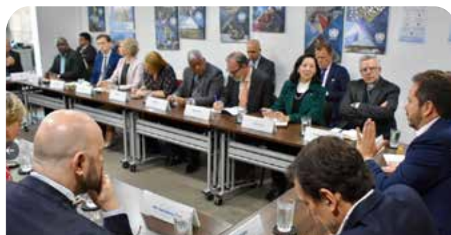
Implementación del Acuerdo de Paz

La Titular asistió, junto con el grupo de países amigos de la Paz en Colombia al segundo diálogo con el Partido FARC en el que se entregó el libro elaborado por la Comisión de Verificación de la antigua guerrilla (CSIVI-FARC) sobre el estado de implementación del Acuerdo para la terminación del conflicto.