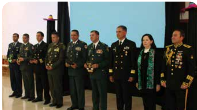
Aniversario del Ejército Mexicano

La Titular ofreció las palabras inaugurales, en las que recordó el origen del Ejército Mexicano como producto de la primera revolución social de México, la cual le dio un carácter revolucionario, popular, social y con el mandato expreso de la defensa de la Constitución.