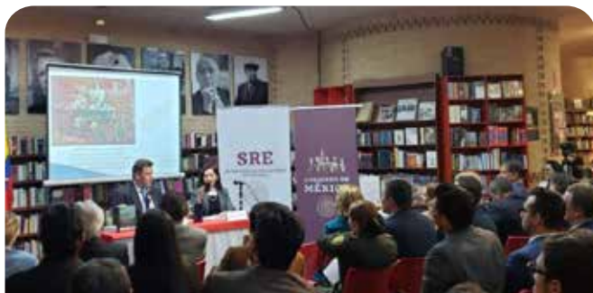
Conferencia “103 Aniversario de la Constitución Mexicana”

En conmemoración de los 103 años de la Constitución Mexicana, la Embajadora Galeana impartió la conferencia “103 Aniversario de la Constitución Mexicana”, en el Centro Cultural Gabriel García Márquez.