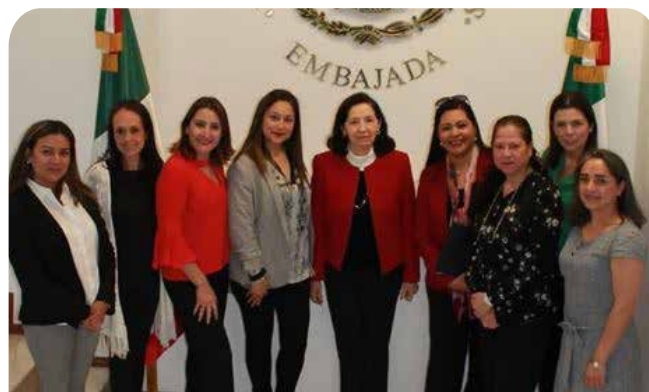
Mexicanas en Bogotá

La Embajadora Galeana recibió a miembros de la Organización de Mexicanas en Bogotá para el desarrollo de actividades conjuntas. La Embajadora resaltó la importancia de visibilizar el trabajo de las mujeres mexicanas y el compromiso del gobierno con la equidad de género y la superación de la discriminación.