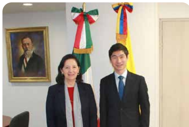
Embajador de China, Li Nianping

Como parte de las visitas protocolarias al cuerpo diplomático, el nuevo embajador de China en Colombia, Li Nianping, realizó una visita de cortesía a la Embajadora Patricia Galeana. En dicho encuentro abordaron el estado de las relaciones con Colombia, destacando el buen entendimiento comercial que hacen a China y México el 2° y 3° importador para Colombia respectivamente.