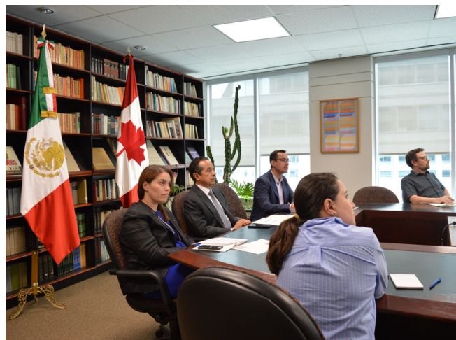
Sesión 1: “Innovación y Desarrollo en Salud”