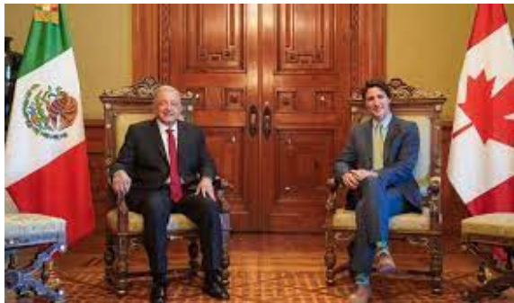
El presidente de México Andrés Manuel López Obrador y el Primer Ministro de Canadá Justin Trudeau

Esta iniciativa ha sido reconocida como un pilar entre la relación de México y Canadá, de tal manera que en enero de 2023, el Presidente Andrés Manuel López Obrador y el Primer Ministro, Justin Trudeau reconocieron el trabajo hecho durante el Lab y, se propusieron expandirlo e involucrar a más jóvenes en el mecanismo de cooperación conjunto, la Alianza México-Canadá.