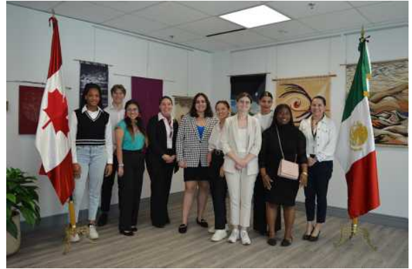
Estudiantes de la Universidad de Ottawa con la Jefa de Cancillería y responsable de Asuntos Educativos y Cooperación Académica.

Posteriormente, la conversación se centró en el trabajo de la Embajada en torno a los derechos de los pueblos indígenas, tema en el que existen grandes coincidencias con Canadá. Los estudiantes aprendieron sobre el compromiso de México con la protección de los derechos de las comunidades indígenas, el respeto y la promoción de su cultura así como la importancia en los diálogos bilaterales y trilaterales.