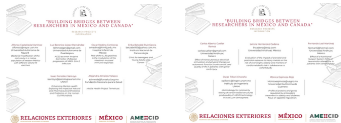
Proyectos presentados en la sesión 1: I+D en Salud