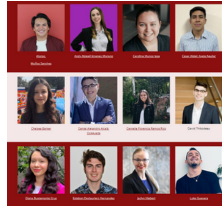
Algunos delegados de la generación 2022 del CANMEX

En la edición 2023, ambas Embajadas tienen un plan de trabajo que se enmarca en la Declaración Conjunta y en los preparativos para la conmemoración de los 80 años de relación bilateral.