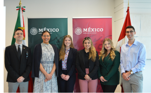
Delegados de la generación 2021 del CANMEX Youth Lab en su evento de clausura en marzo 2022

El Lab de Jóvenes pretende ser el proyecto más importante en el involucramiento de los jóvenes de ambas naciones para fortalecer la relación bilateral. Las primeras dos generaciones han conocido de la mano de expertos, temas que son relevantes para la definición de acciones para ambos países. Así mismo, los exdelegados canadienses y mexicanos trabajaron en conjunto propuestas que han sido formalizadas en comunicados finales que se publicaron y fueron difundidos por ambas embajadas. Por último, han podido participar en las sesiones de los diferentes grupos de trabajo que forman parte del mecanismo de cooperación conjunto, la Alianza México-Canadá , lo cual les brindó la experiencia de conocer de cerca su funcionamiento y poder expresar su punto de vista sobre algunos de los temas eje.