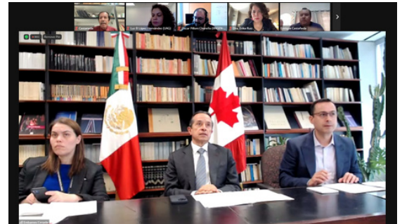
Durante una reunión vía "Zoom", los investigadores tuvieron la oportunidad de presentar sus proyectos ante sus pares canadienses, asimismo, se contó con la presencia y participación del Embajador Carlos Joaquín González.

El objetivo de realizar estas sesiones, además de fortalecer conexiones (networking) entre investigadores canadienses y mexicanos, es el de buscar proyectos de cooperación científicos, técnicos y de innovación que deriven de las propias investigaciones de los participantes. Al respecto, se espera que algunos de los proyectos presentados puedan generar colaboraciones en un futuro con algunos de los invitados canadienses.