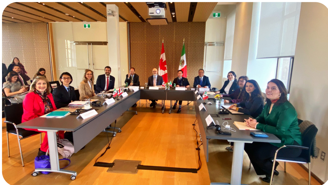
Sesión de apertura de la 18a sesión de la Alianza México - Canadá

Boletín mensual del área de Asuntos Educativos y Cooperación Académica de la Embajada de México en Canadá