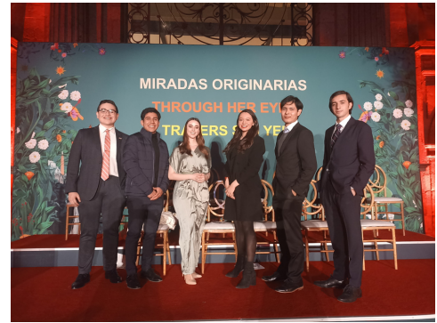
Delegados mexicanos del Laboratorio de Jóvenes CANMEX en el evento organizado por la Embajada de Canadá en México "Miradas Originarias".

En enero participamos en la exposición del Museo Nacional de las Culturas del Mundo "Miradas Originarias". Unos días antes, recibí la propuesta por parte de Fondo Canadá para realizar un voluntariado, misma que acepté y colaboré en la organización del evento. Esa noche, contamos con la presencia de Beatriz Gutiérrez Muller, esposa del Presidente de México y la señora Sophie Grégoire Trudeau, esposa del Primer Ministro Canadiense. Para nosotros, como delegados mexicanos, fue una gran experiencia asistir.