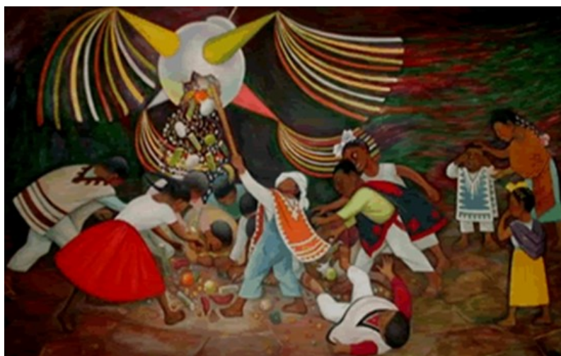
“La piñata” - Diego Rivera

¡La Embajada de México en Austria le desea Feliz Navidad y un feliz Año 2017!