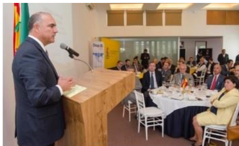
José Calzada Roviroso, Titular de la SAGARPA

El titular de la Secretaría de Agricultura, Ganadería, Desarrollo Rural, Pesca y Alimentación (SAGARPA), José Calzada Roviroso, señaló que el campo mexicano es un ejemplo de productividad. Actualmente el país se ubica en 12º lugar en producción de alimentos, por lo que de continuar con un crecimiento similar, en el mediano plazo podría ubicarse entre los primeros diez lugares. Según estimaciones, por cada hectárea cultivada en México se obtienen alrededor de mil 800 dólares.