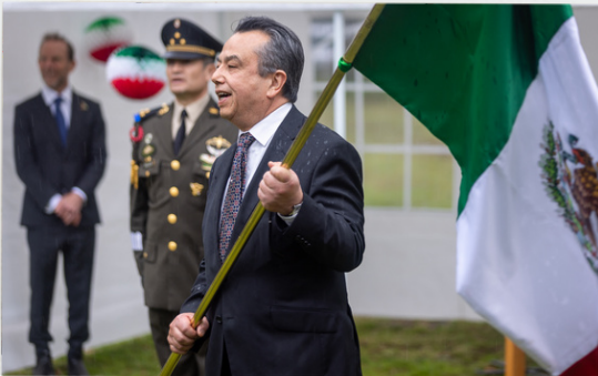
Australia 15.09 22

En su discurso, el embajador resaltó los valores del México independiente y los puntos de coincidencia en la relación bilateral con Australia, incluidos los lazos comerciales y la importante contribución de la comunidad mexicana a la economía y cultura australiana. Posteriormente, procedió a dar el emotivo Grito de Independencia.